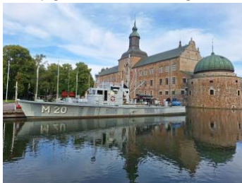
M 20 i Vadstena