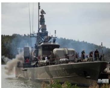
R142 Ystad värmer upp