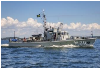
Museifartyget M 20