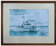
M 20 under gång, 2100 kr

Rädda museifartyget M 20 och få vackra tavlor