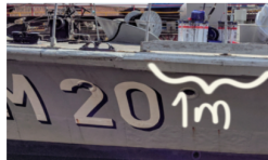
En meter sudband, 2000 kr

Rädda museifartyget M 20 och tag plats på givartavlan