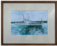
M 20 stillaliggande, 2100 kr

Vår med och bidrag till renoveringen av den unika minsveparen M 20 och få en professionellt inramad akvarellreproduktion i vacker träram (40x32 cm, Brandt ramverkstad). Det finns endast 30 numererade och signerade (Ulf Almqvist) exemplar av vardera motiv.