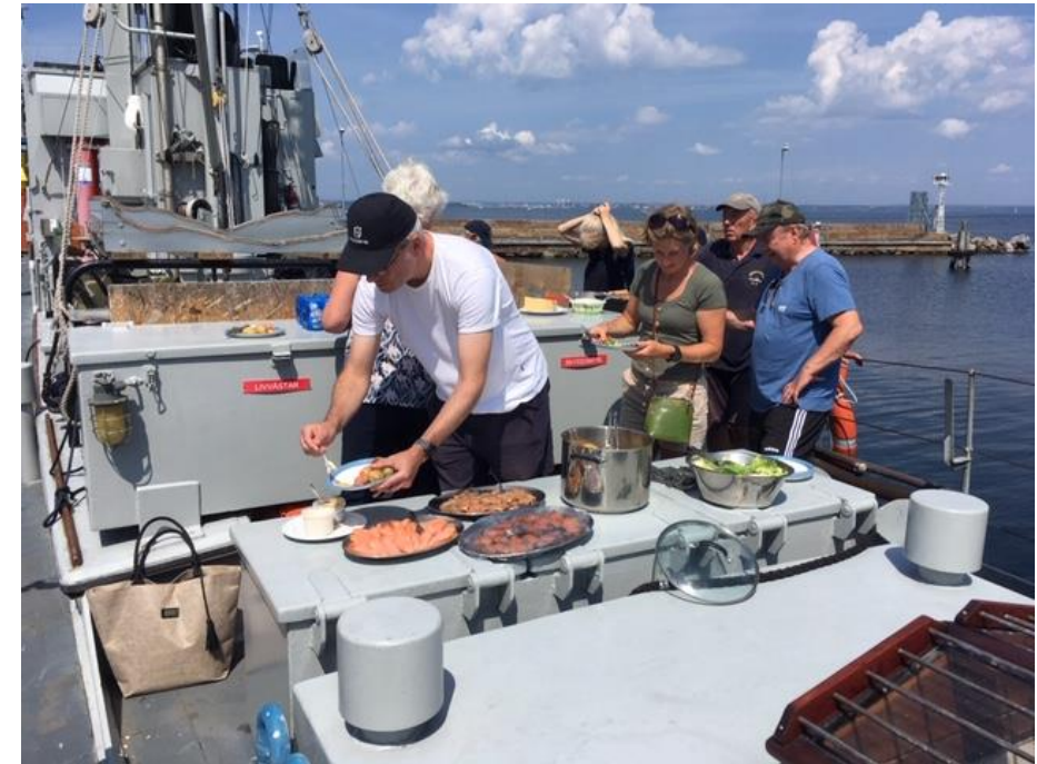
Rökt & gravad lax, sallad & potatis