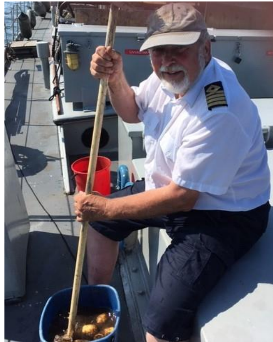
FC skrubbar "plugg