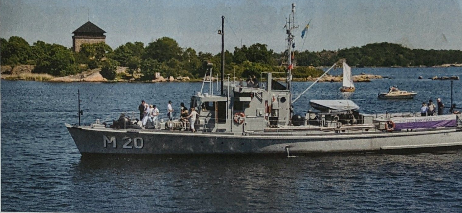
ANRIK BÅT. Minsveparen M20 är snart 80 år gammal.