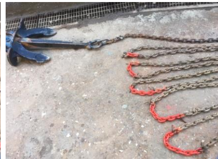
135 m uppmärkt ankarkätting