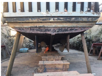
Uppallad och stämplad