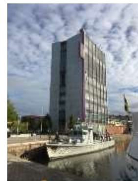
Löfbergs Lila, Karlstad

Det visade sig att två av de ombord på Kbv hade tidigare tjänstgjort ombord på M 20!