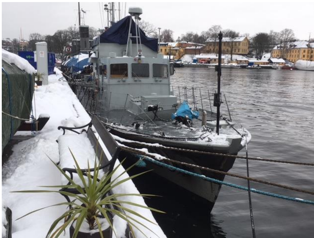
M 20 i vinteride efter rejäl snöskotning vid VAF 2 februari!